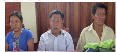
DIRECTIVO DE CONAP Confederación Nacionalidades Amazonicas