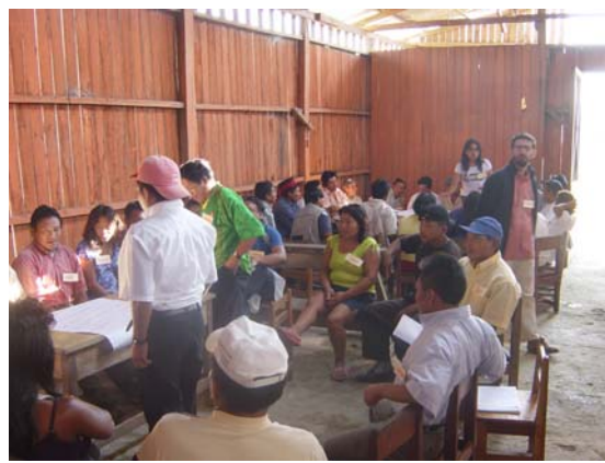
Imágenes del taller Indígenas Cantagallo 2/3 de septiembre ( ver Palabra Viva Pag. 72)